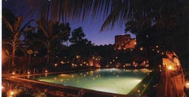
Piscine d'Ahilya Fort, ancien palais de maharaja.

Rens. : 00-91-11-415-515-75, www.ahilyafort.com