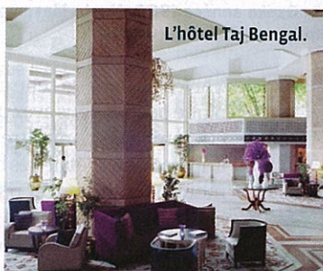
L'hôtel Taj Bengal.

► Taj Bengal : vaste hôtel 5 étoiles avec piscine situé non loin du Victoria Memorial. A partir de 69 € par personne en chambre double, petit déjeuner inclus. 00-91-33-2223-3939 et www.tajhotels.com