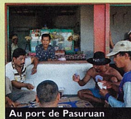
Au port de Pasuruan

● Paris-Solo aller-retour à partir de 935 € sur Singapore Airlines. Combiné Java-Bali, Paris-Solo/retour Bali-Paris, au même tarif. 0821-230-380 www.singaporeair.com