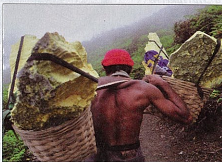
Extirpées du cratère, les plaques de soufre sont redescendues à dos d'homme

On découvre ainsi le port de Pasuruan avec ses goélettes appelées phinisis , ses modestes bouis-bouis qui sont l'équivalent de nos bars à matelots; un marché qu'on explore à Probolinggo où, dans la touffeur des halles,